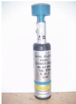
Signal Underwater Sound MK411 (Reduced Charge) (SUS) Signal Underwater Sound MK 410 (High Explosive)