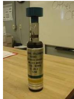
Signal Underwater Sound Mk411 Length 38.1 cm Diameter 7.62 cm