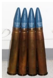
Cartridges 40mm Practice (BL/P)