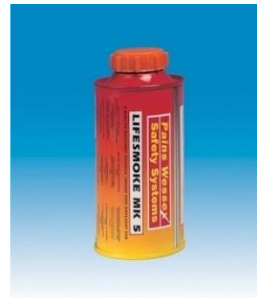
Signal Smoke Marine MK3 Orange