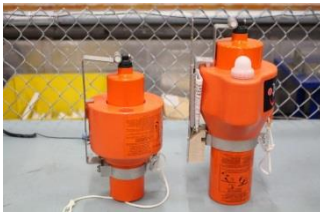
Marker Man Over Board (MMOB)