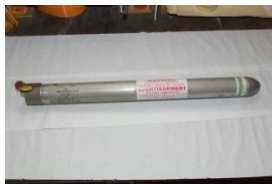
Signal Smoke and Illumination Marine Mk 66 Mod 2