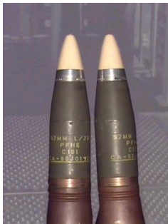
Cart 57mm Pre-Fragmented High Explosive