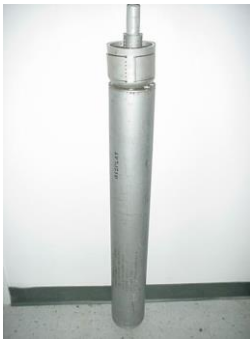
Cartridge 5.125 Inch Chaff