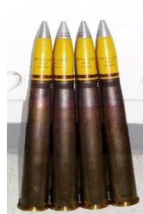
Cartridge 40mm High Explosive-tracer (HE-T)