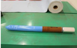
82 mm Rocket Practice MASS Decoy