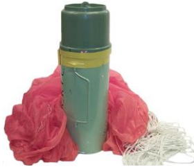
Signal Smoke Aircraft Orange Drift Indicator C8