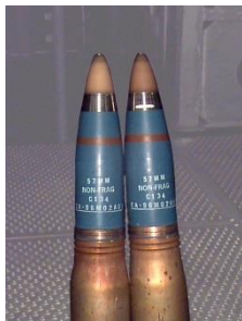
Cartridge 57mm Non-Frag Brown Band Low Explosives