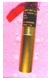
Depth Charge High Explosive DM211 Anti-Frogman