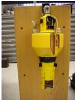
Marker Man Overboard, Light And Smoke, Series III