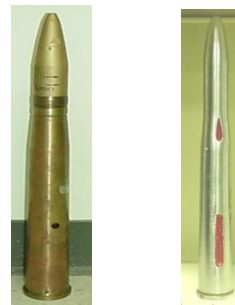
Both are inert Dummy 40mm Drill 40mm