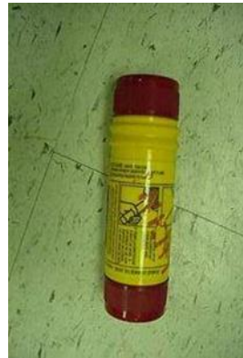
Signal Distress Day and Night Length 135 mm Diameter 42 mm