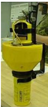
Marker Man Overboard Smoke and Light

Length 500 mm Diameter 190 mm (including the float)