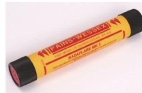
38mm Hand Held Illuminating Signal Flare (Radaflare)