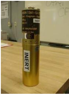
Depth Charge HE DM211 Anti-Frogman