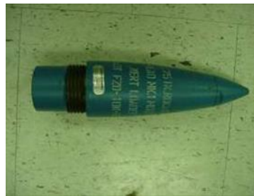
2.75 inch warhead

Autorité : Ministère de la Défense nationale (QGDN)