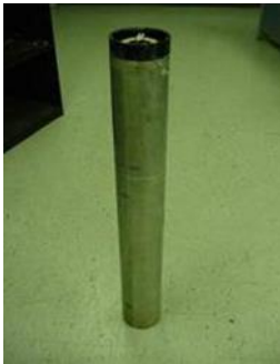
Flare Aircraft Parachute LUU 2AB/2BB Length 91.4 cm Diameter 12.4 cm