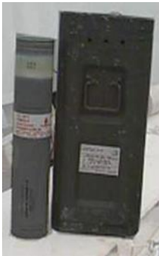
Marker Location Marine Mk 58 Length 21.5 inches Diameter 4.9 inches