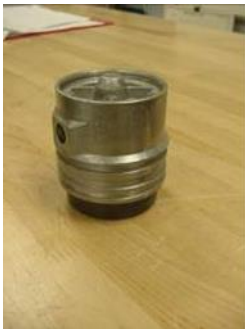
Signal sound Marine Height 8.89 cm Diameter 7.62 cm