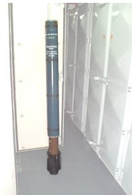
Rocket 100mm Radar Echo Practice C20