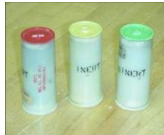
Signal Illum A-C Single star 1.5 inch Length 82.6 mm Diameter 38 mm