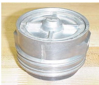
Signal Sound Marine MK NC 1 Mod 1